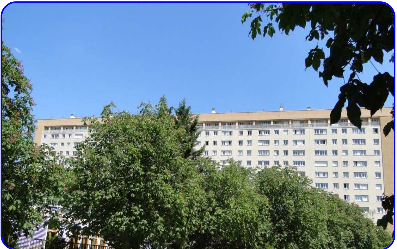
Immeubles de la cité Anatole-France, construits à partir de 1953 / architecte : Bernard Zehruss. (Photo du haut : fonds du Ministère de l'écologie, du développement durable, des transports et du logement).